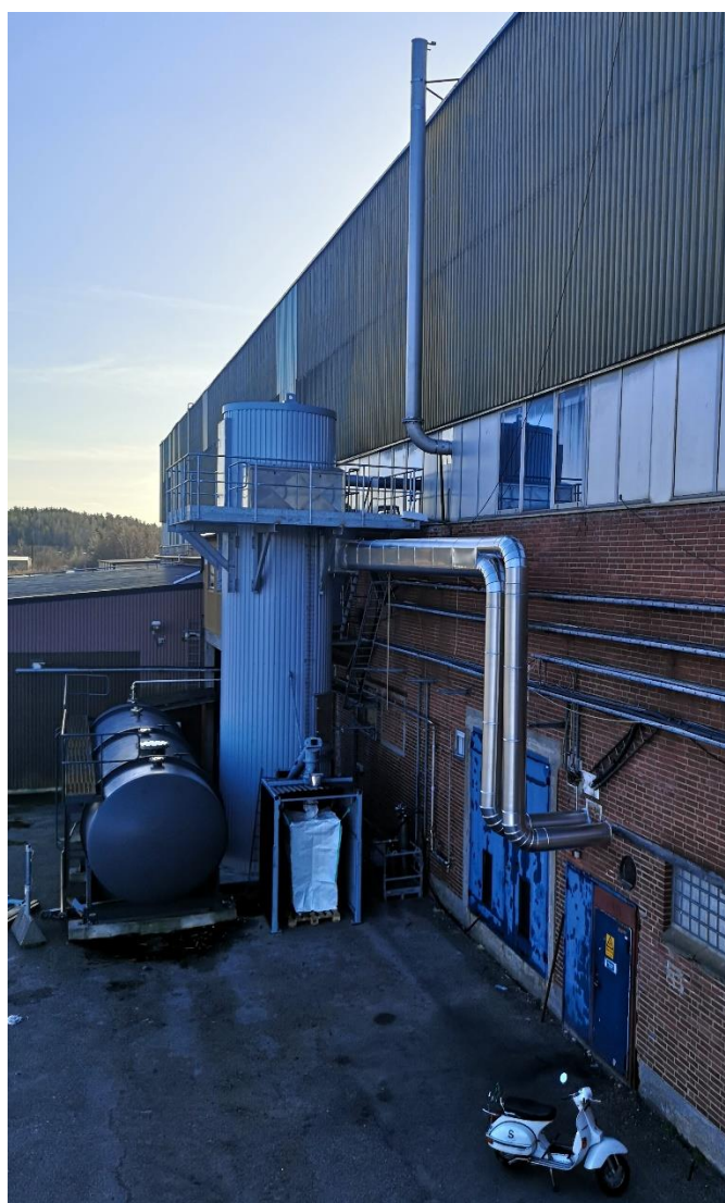
Ovanstående bild visar hur en förbättring av vår rökgasrening numera ser ut i vår anläggning i Åsensbruk